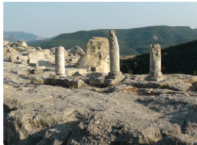
Фиг. 4. Разкопките на Перперикон