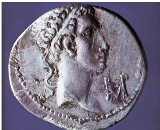
Фиг. 2. Монета на тракийския цар Раскупор I (16 г. пр.н.е. – 14 г. от н.е.)