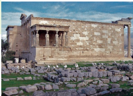
Фиг. 1. Ерехтейонът на Атинския акропол

Материалните извори са всички веществени паметници, направени от хората, използвани от тях и оцелели до наши дни. Това са сгради ( фиг. 1 ), предмети на бита, сечива, оръжия, монети ( фиг. 2 ), градежи и произведения на изкуството ( фиг. 3 ). Тези извори се наричат още и археологически . Чрез тях археолозите изследват отминалия жи-