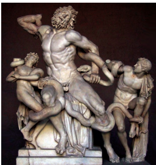
Фиг. 3. Лаокоон и синовете му, борещи се с морски змии, древногръцка скулптура по митологичен сюжет