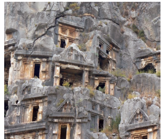
Фиг. 5. Скални гробници от древна Ликия